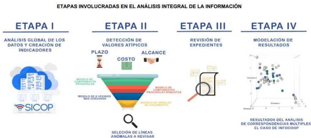
Figura A Etapas análisis de la información